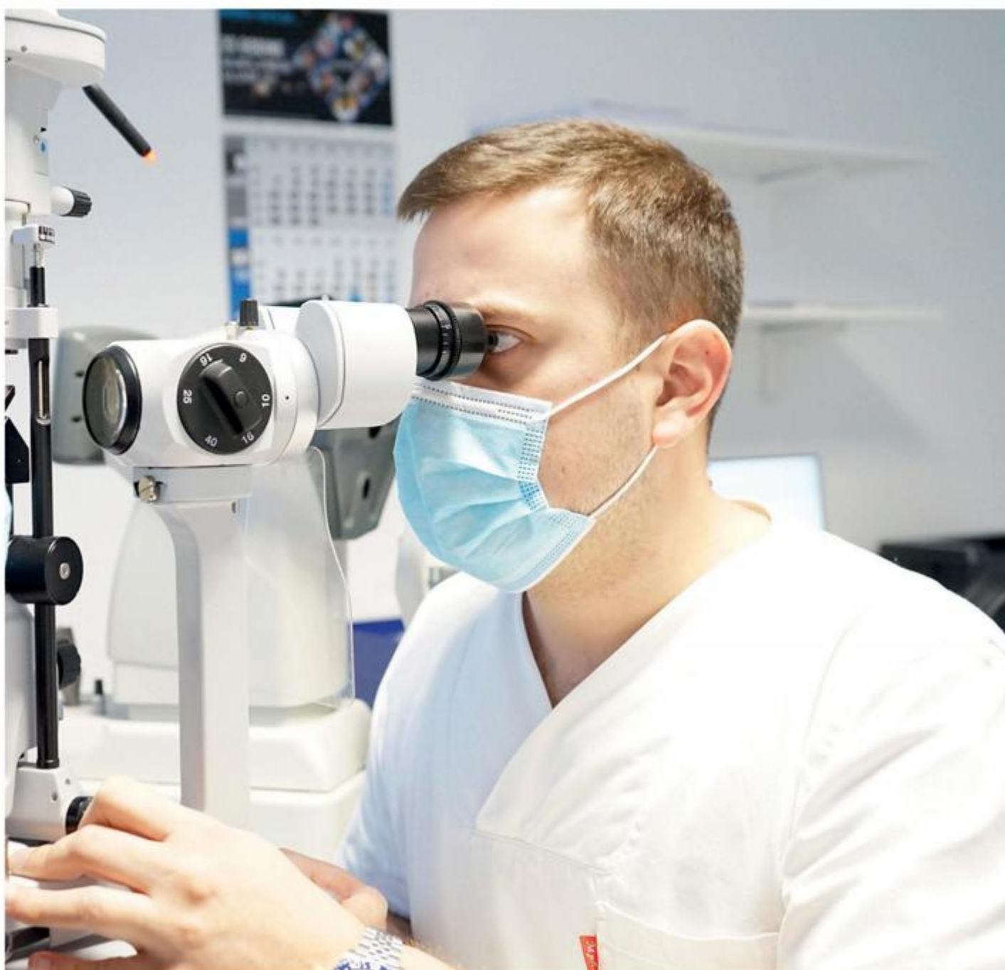
*Sadržaj nastao u suradnji s Klinikom Svjetlost