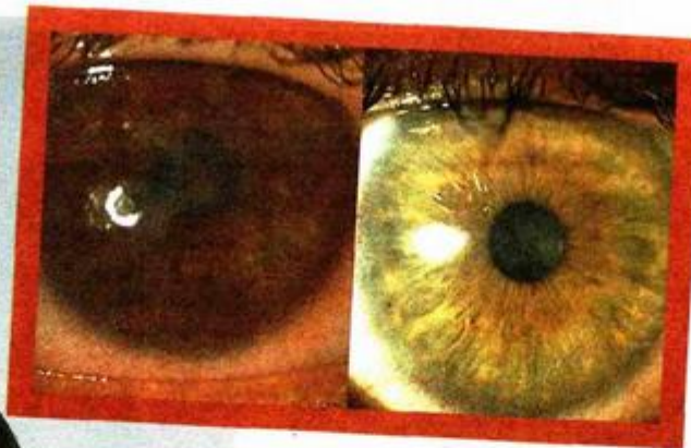
Ozlijeđena rožnica oka prije operacije (lijevo) i bistro oko nakon transplantacije (desno)

je teško oštećena prednja površina oka - objašnjava prof. Dekaris.